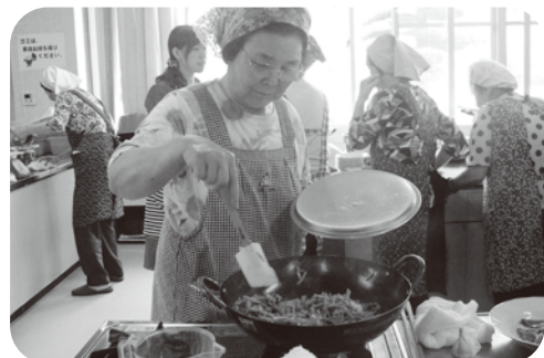
▲慣れた手つきで調理をされていました