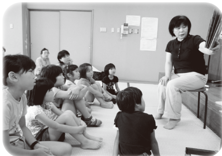
▲ お話しに身を乗り出して聞いています