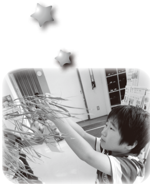
▲▼ 願い事を短冊に書いて飾りました