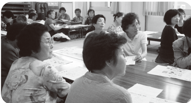
▲管理栄養士の講話に聞き入っています