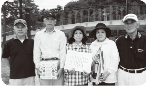
▲優勝した山口Cチームの皆さん

老人クラブ会員約160人48チームによるペタンク大会を開催しました。心配した雨も試合中はピタリと止み、白熱した試合が繰り広げられました。「久しぶりね～。元気とった？」と試合の中で、他の地区の会員との交流も深めることができました。参加された選手の皆さん、お疲れ様でした!