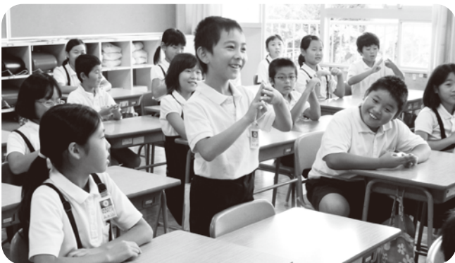
▲指をつかって田んぼの「田」を表します