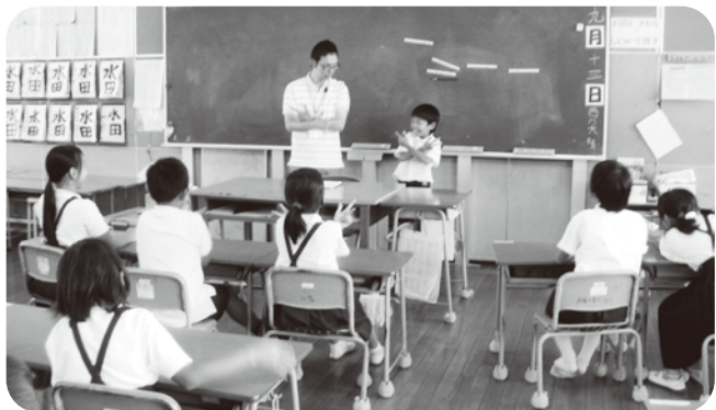
▲みんなの前で、手話で自己紹介をしました

今年も、社会福祉協議会の職員が、4年生を対象に、点字と手話の学習を行いました。実際に点字盤を使って自分の名前を打ってもらい、その後、手話で挨拶と自己紹介をしてもらいました。子どもたちに「点字をおうちの中で見たことある人？」と尋ねると「家のトイレで見たことがある!」「テレビのリモコンについているよ!」と教えてくれました。ぜひ、ご家庭でも子どもたちと一緒に点字を探されてみてはいかがでしょうか。