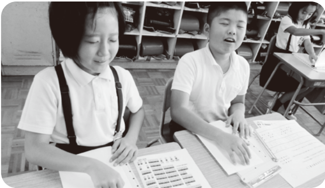
▲目を閉じて自分の名前、読めるかな？