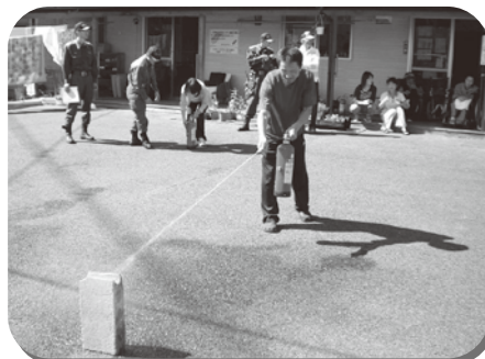
▲ 水消火器で消防訓練