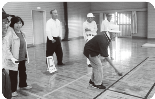
▲ 両者譲らず、なかなか決着が付きませんでした

9月4日の大会当日、午前中はあいにくの雨で、和水平町体育館にてペタンク競技のみ行いました。午後からは選手の皆さんの気合に押され、青空が広がり、和水平町番城グラウンドで予定していたグラウンドゴルフも行うことができました。