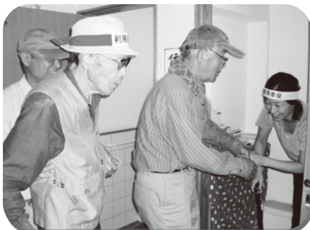
▲ 地域の方も利用者役で参加していただきました

10月12日(土)秋晴れの中、地域の皆様のご指導とご協力のもと、平成25年度の消防訓練を開催いたしました。直前に、福岡で起きた病院火災を受け、これまで以上に真剣に取り組みました。地域の皆様や、玉東分署消防士の皆様から頂いた貴重な意見や、改善案を活かしていきます。ありがとうございました。