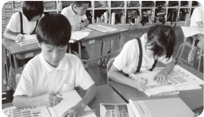
▲真剣に点字を打つ児童たち