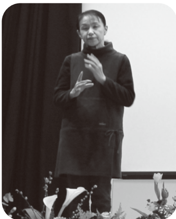
▲手話は玉東わかぎ・玉名わかぎの方々でした