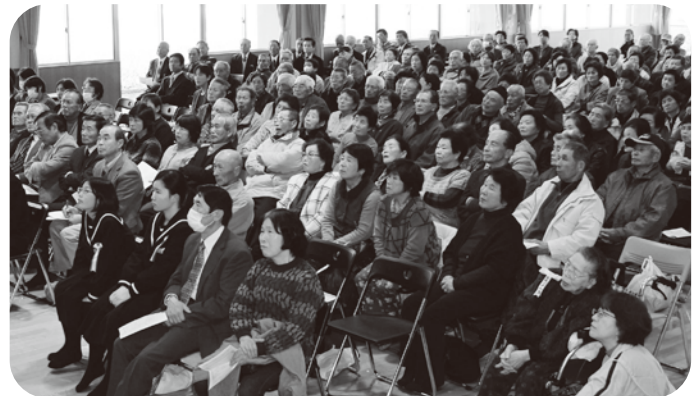
▲参加された方々も傾きながら講演を聞かれていました