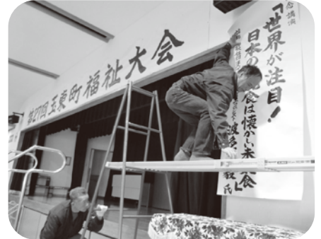
▲看板設置をして頂いた玉東町建築組合の方々