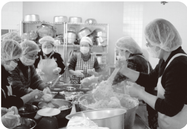
▲おにぎりをにぎる葉山苑の職員さん