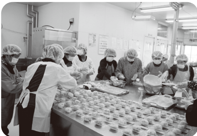
▲おにぎりを作るオレンジクラブの女性リーダーの皆さん