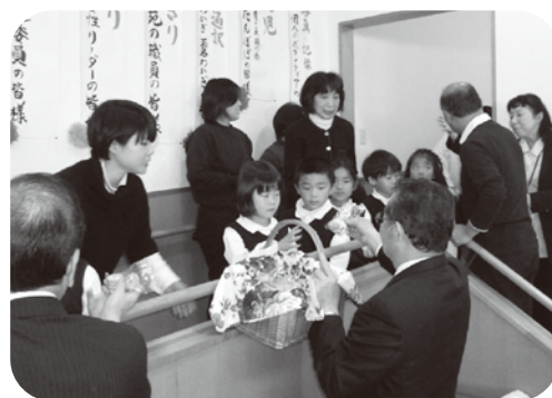
▲お礼のクッキーを受け取る園児たち