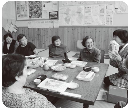
◀ ちょっとした出し物もあり、皆さん楽しめました(白木公民館)