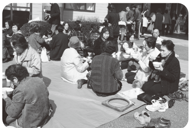
▲暖かい日差しの中、食事をとられました