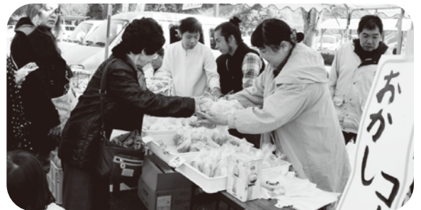
▲るびなすによるパン・お菓子の販売