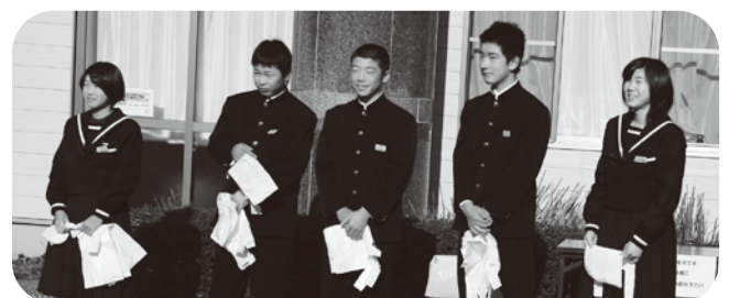
▲玉東中学生徒会の皆さんが元気のいい挨拶で出迎えてくれました