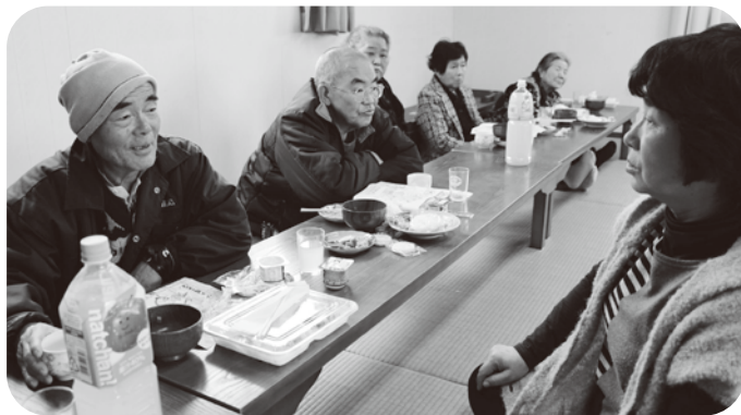
◀ 食後7分間が弾み賑やかでした(栗山コミュニティセンター)