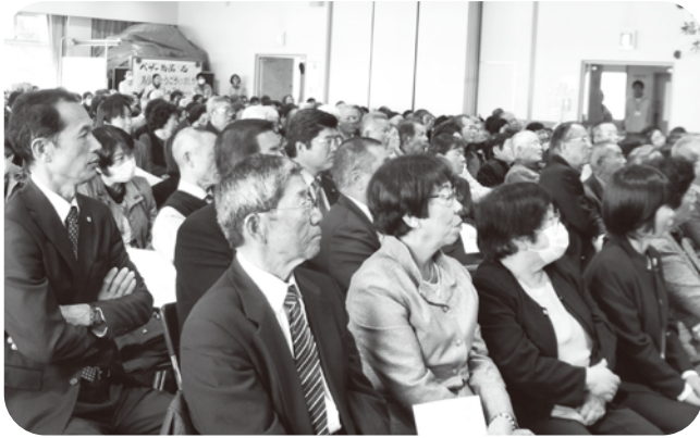
▲たくさんの方々が来場されました

今年で27回を向かえた玉東町福祉大会。青空が広がり、たくさんの方の参加と協力で、今年も盛大な福祉大会となりました。