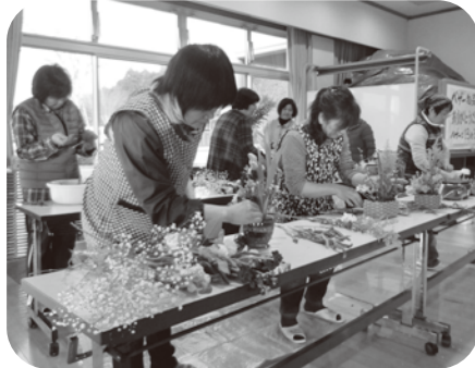
▲フラワーアレンジメントの方々には会場の装飾をして頂きました