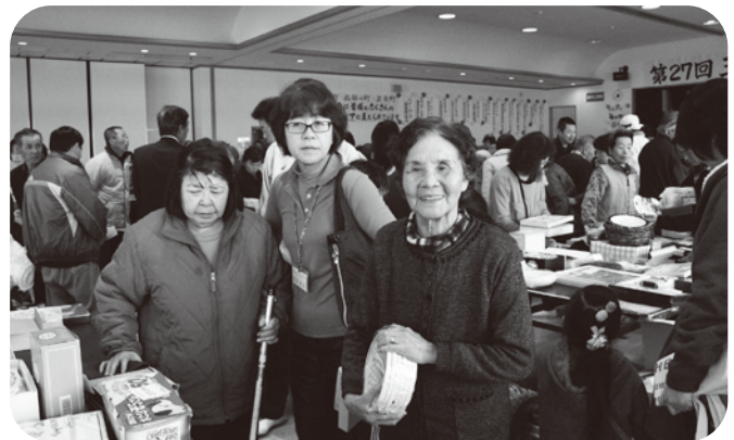
▲掘り出し物は見つかったでしょうか