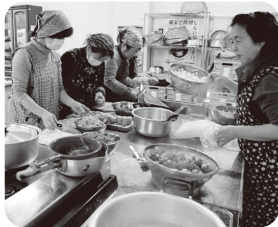
◀ 手作りのお弁当に、作り手さんも気合いが入ります(中央公民館)

参加された方々は、「いつも一人で食べよるけん、寂しかけど、今日は楽しかった〜!」と久しぶりに大勢の人に囲まれての食事に会話も弾み、いつもと違う雰囲気を楽しまれました。