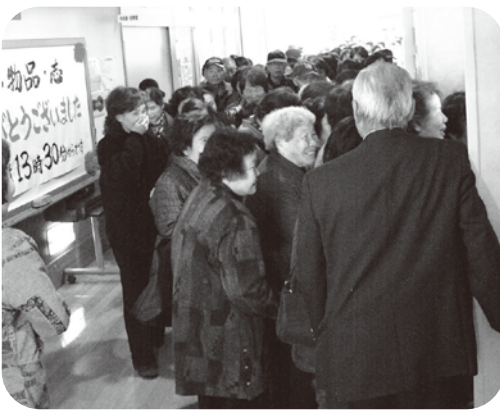
▲廊下には長い行列ができていました

町民の皆様より、1,504点のバザー物品の提供がありました。本当にありがとうございました。