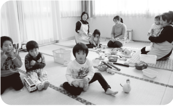
▲たんぼさんの託児も大人気でした