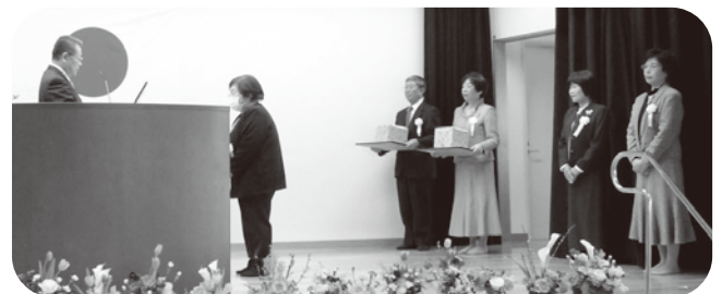
▲表彰を受けられた方々