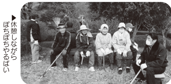
▶ 休憩しながらほちほちやるはい