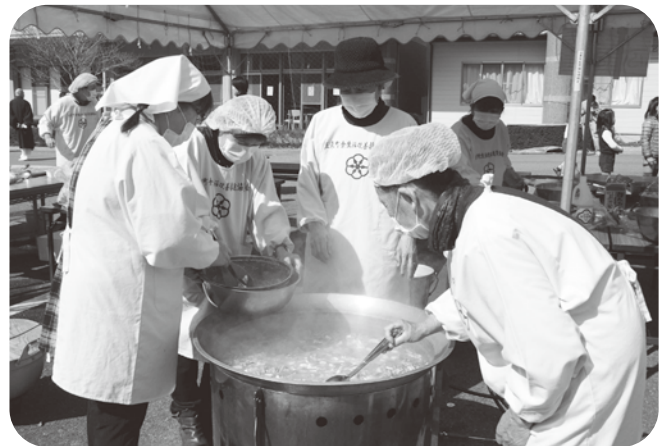
▲豚汁を作られた食生活改善推進協議会の方々