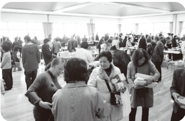
▲午後の会場は沢山の品物と人で溢れ、大盛況でした