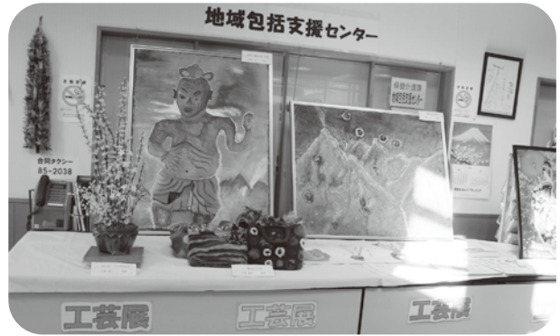
▲手の込んだ素晴らしい作品が並べられました