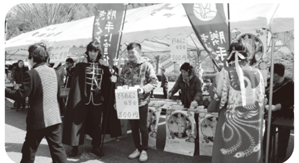
▲博愛灯会へ向けた出展もありました