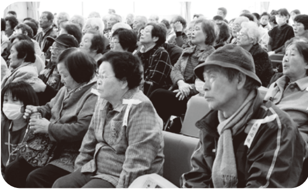
▲福祉サービスの利用者の方々にも参加していただきました