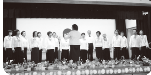
▲美しい歌声を披露されたコール野ばらの皆さん