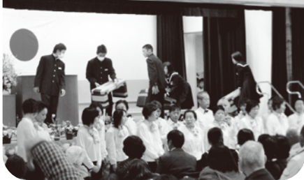
▲ステージの準備は中学生が手伝ってくれました