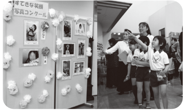
▲お友だちが写っていたかな？