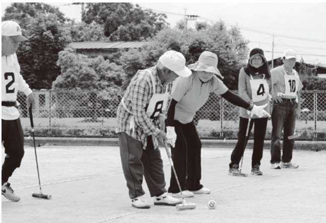
▲みんなが見守るなか、緊張の一打

7月5日（土）荒木観光ホテルで、第34回熊本県身体障がい者ゲートボール大会が開催されました。県内の16チームが集まり、熱戦が繰り広げられ、親善試合では、玉東町が2位に入賞しました。