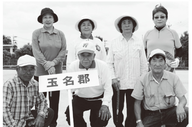
▲出場された皆さん