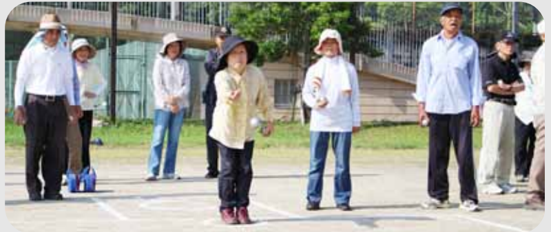
▲みんなが見守る中、それーっ!!