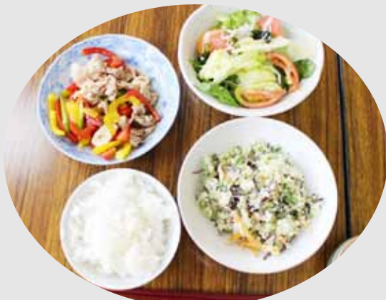
▲メニューは… ご飯・アスパラと豚肉のオイスターソース炒め・ レタスとトマトのさっぱり和え・きくらげとねぎ のピリ辛卵の花

レシピを片手に、または、先生や隣の班に相談したりなど、天気は雨でしたが、大いに賑わい、とても美味しい料理が出来ました。