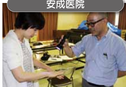
「子どもの病氣とケガ」での手洗い実習