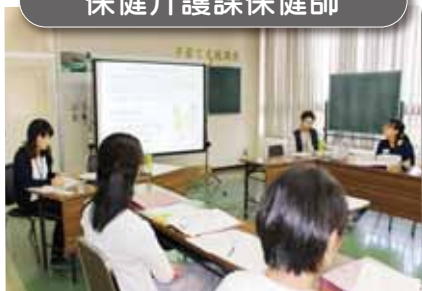
「看護について子どもの食生活について」