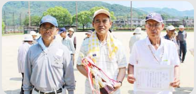
▲優勝された二俣西の皆さん