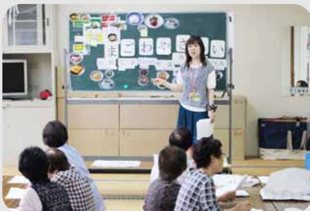
▲最初に管理栄養士さんからのお話がありました。