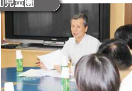
「子どもの社会性に対応」