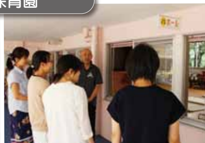
「心構えと安全管理」での園内見学