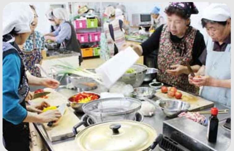
▲あとは何ば切らなんだったかね?