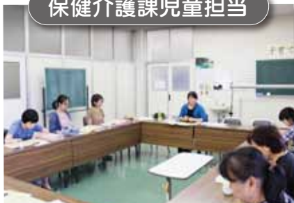
「玉東町の保育現状」