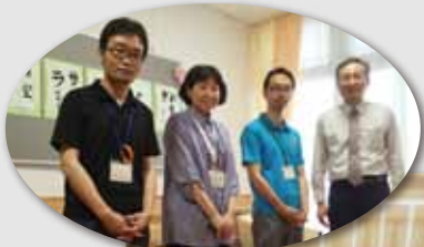
いこいの里の 施設長さんと 社協スタッフ