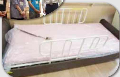
▲寄付させていただいたベッド