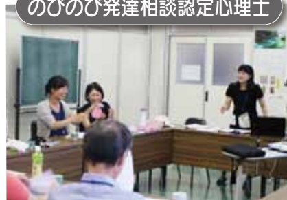
「子どもの心の発達とそこのかわり」