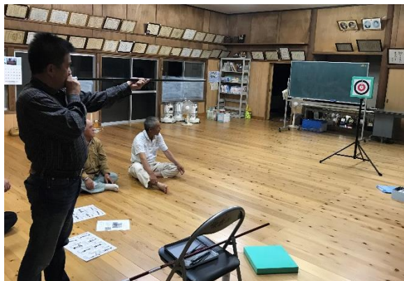
毎月第一土曜日に行われている、原倉西公民館の様子。

平成31年2月15日(金)にスポーツ吹き矢大会を開催します。下記の日程で体験会を実施します。「まだやったことがない」、「大会前に教えて欲しい」という方、ぜひお友達をお誘いの上ご参加下さい。