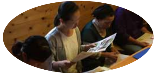
▲ログさんちでの情報交換会の様子

10月25日に小天オレンジテラス、森のひろばログさんちへ視察研修に行ってきました。小天オレンジテラスでは、防災・食育に因んだ、ペットボトルピザを作りました。自分の体温で発酵させたり、初めての体験に皆さんわくわくで参加されてました。森のひろばログさんちでは、施設内を見学したり、情報交換をしたりしました。