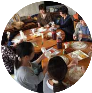
▲ペットボトルピザ体験中