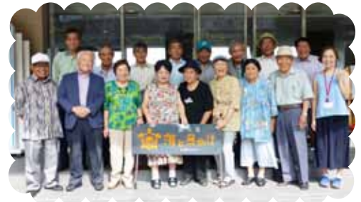
▲今年は天草に研修旅行に行きました

ペタンク大会、グラウンドゴルフ、歌謡祭などいろんなイベント盛りだくさんです。障がい者手帳をお持ちの方なら入会できます。会員さん同士で親睦を深め、楽しい会です。年会費は1,000円です。