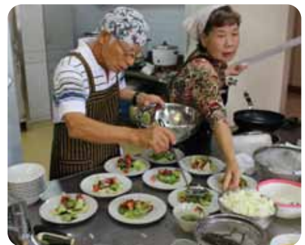
▲最後の盛り付けが肝心だな〜