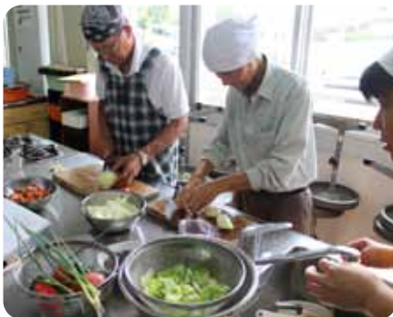
▲玉ねぎ切るともむずかしか〜