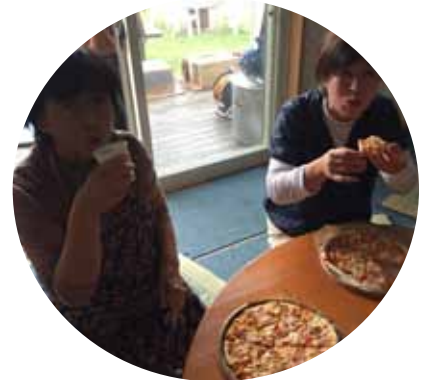
▲できたてのピザは最高です!!