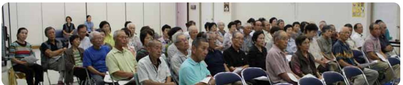
▲真剣に聞かれる参加者の皆さん