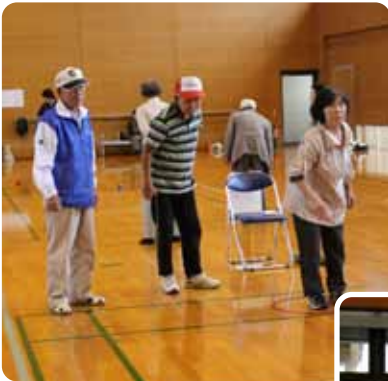
▲よかところにいったばいな〜

10月28日(金)に、町民体育館にて、南関・和水・長洲・玉東町の玉名郡身体障がい者球技大会が行われました。あいにくの雨で、体育館でのペタンク競技でしたが、雨にも負けない白熱の試合が繰り広げられました。