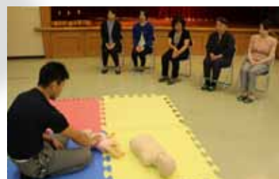
▲有明消防 玉東分署

6月12日より開講し、7月12日に閉講しました。今年は、専門の先生方も招き、なかなか聞くことのできないお話をさせていただきました。また、フォローアップとして受講される方も多く、とても充実した講座となりました。