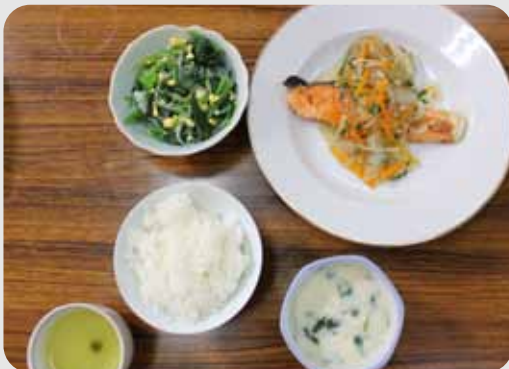
▲メニューは… ご飯・鮭のきのことあんかけ・ほうれん草の中華風炒め 豆苗の豆乳スープ