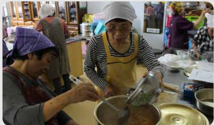
▲よかあんばいで出来よるこた〜