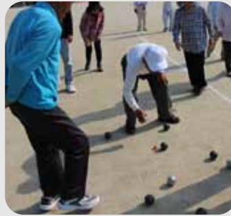
▲どっちが近かなー