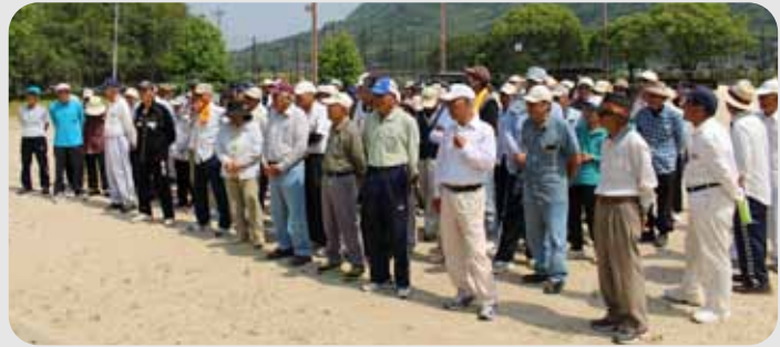
▲参加されたみなさん