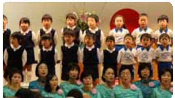
▲昨年の福祉大会の様子