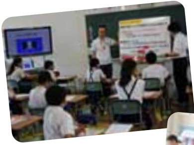
事前学習として、社協職員より認知症サポーター養成講座を受けます。