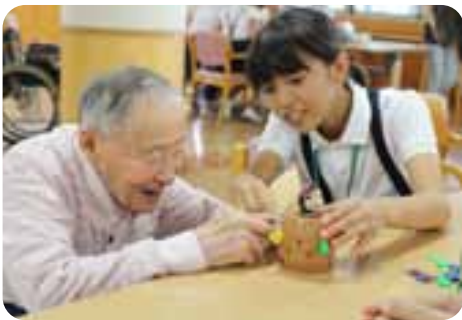
遊び方を教えてもらったり、教えたり