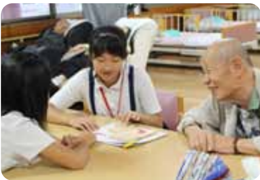
みんなでゲームはたのしか～