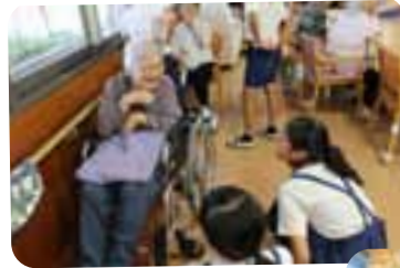
目線を合わせてお話しをしています。