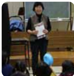
清田会長よりキャンドルナイトの説明