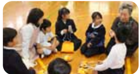
▲最後は班のみんなで交流会