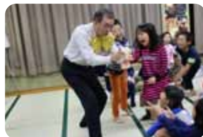
笑顔のたまたて箱さんの手品ショー