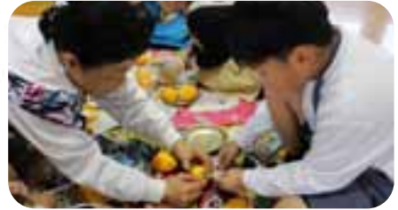
▲蒂に紐を括り付けます