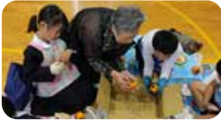
▲まずは、蒂を取ることから