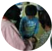
おいしい納豆ができますように