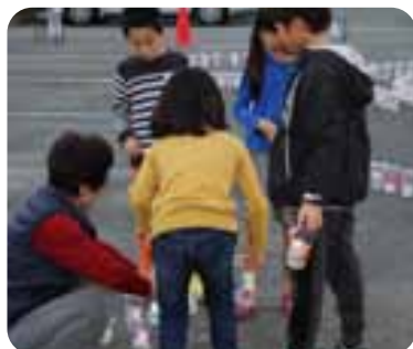
自分で作成したキャンドルカバーを並べました