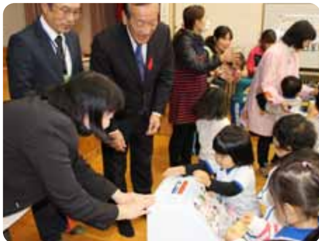
▲山北保育園での募金のようす▼