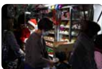
ローソンサンタよりお菓子のプレゼント