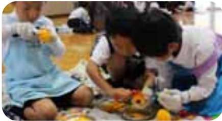
▲こがんと剥くとばい!