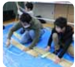
今年も届けに来ましたよ~