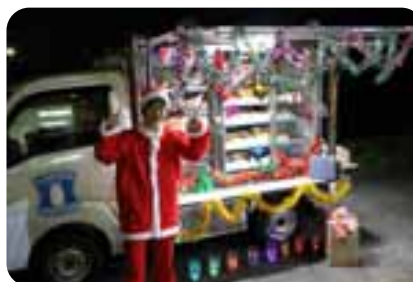
ローソンからサンタ登場!!