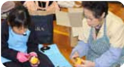
▲きれいに剥けるね~