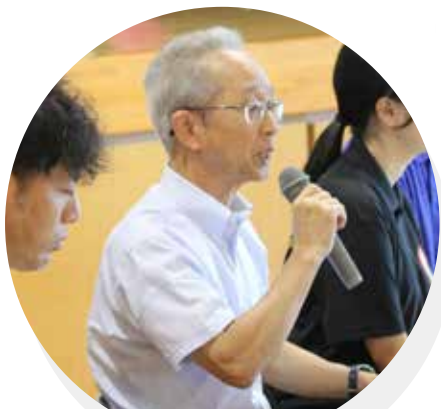
NPO法人れんげ国際 ボランティア会

シンポジウムでは、まず各シンポジストから、活動報告をしていただき、公開討論会を行いました。活動内容や場所は、違いますが、みなさんの活動内容や思いに、来場者の皆様も深く感心されていました。