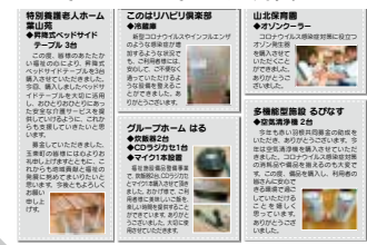
福祉大会紙面開催の感想をいただきました。