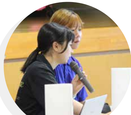
CDST(地域社会災害サポートチーム) おれんじびーす