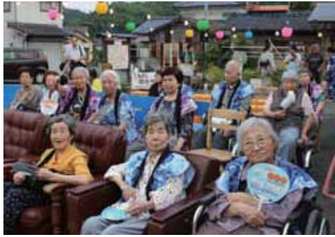
▲毎年楽しみにしとるもんなあ〜