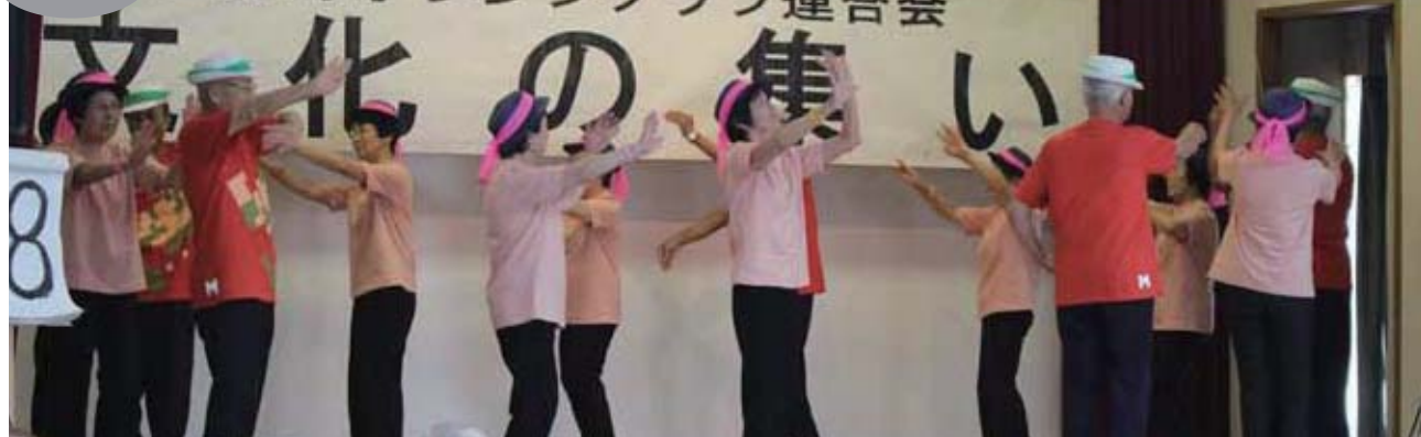
▲町区による「銀座カンカン娘」