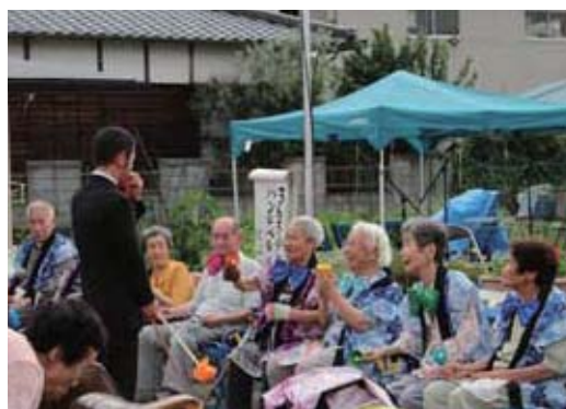
▲はぶの合唱団によるハンドベル演奏