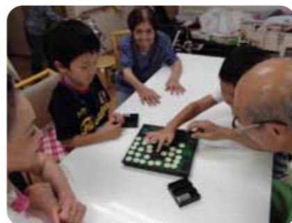
▲利用者さんとオセロで盛り上がりました

◆そうめん流しやゲームをおばあちゃんたちとして、楽しかったです。かき氷もいろいろなミツをかけて、美味しかったです。