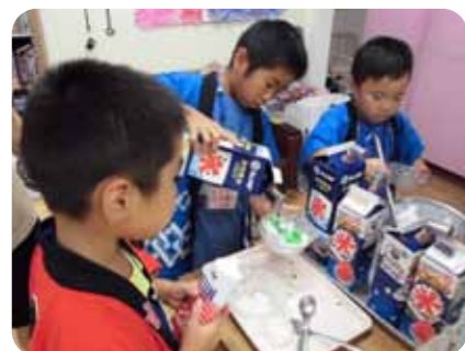
▲いろいろな味の密をかけて…