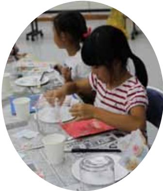
▲お気に入りのペーパーを切り取り中