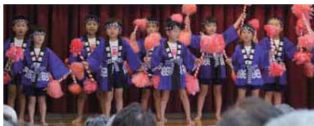
▲木葉昭和児童園による「津軽はね太鼓」