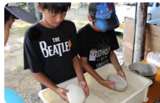
▲お米は飯盒で炊きました

今年も、木葉小・山北小5年生を対象にワークキャンプを障害者支援施設たまきな荘にて行いました。施設見学や車椅子操作、障害ニュースポーツを通じて、27名の参加者は、福祉について学びました。また、みんなで協力しながら、テントを立てたり、夜ご飯、朝ご飯を作ったりと、親睦も深めました。