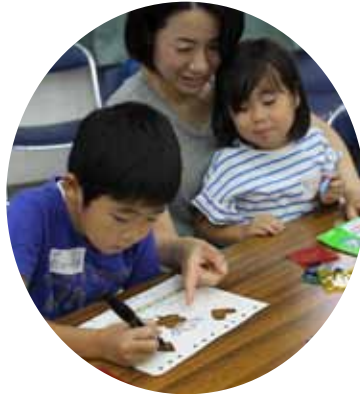
▲牛乳パックのカバーを作成中