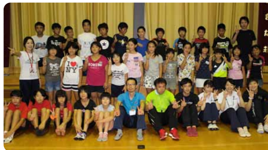
▲参加した5年生とスタッフ

今年も、木葉小・山北小5年生を対象にワークキャンプを障害者支援施設たまきな荘にて行いました。施設見学や車椅子操作、障害ニュースポーツを通じて、27名の参加者は、福祉について学びました。また、みんなで協力しながら、テントを立てたり、夜ご飯、朝ご飯を作ったりと、親睦も深めました。