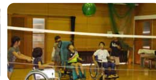
▲白熱した風船バレー