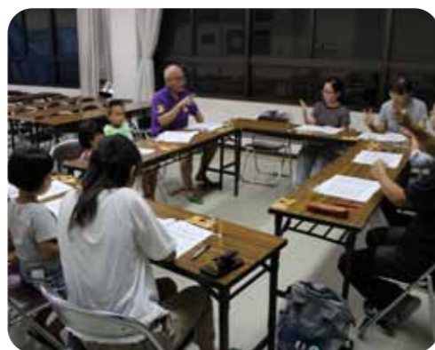
▲挨拶を覚えました