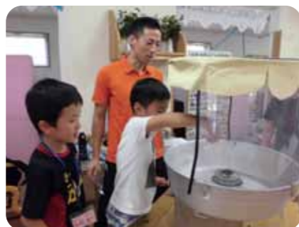
▲綿菓子も作れるようになりました