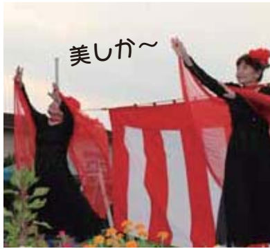
▲カトレア会による舞踊