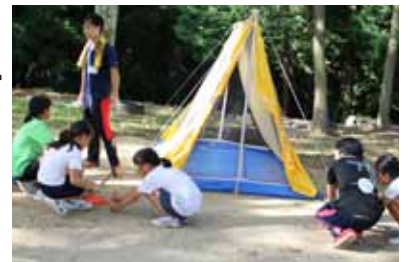
▲ワークキャンプの様子