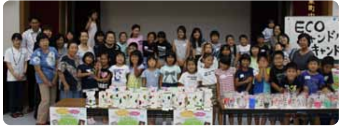
▲参加者のみなさん

玉東子育て支援会たんぽぽ主催のECOキャンドルカバー&キャンドルづくりが中央公民館にて行われました。30名を超える参加者で、個性あふれるキャンドルカバーがたくさんできました。9月24日には、ミュージックケアも計画しておりますので、ぜひ、ご参加ください。