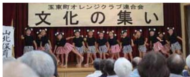
▲山北保育園による「くまモン体操」