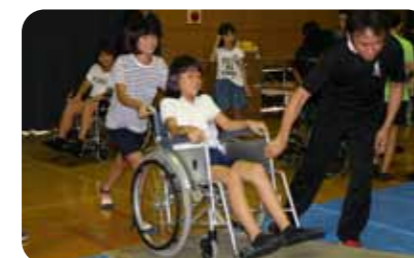
▲相手の事を考えながら、操作します