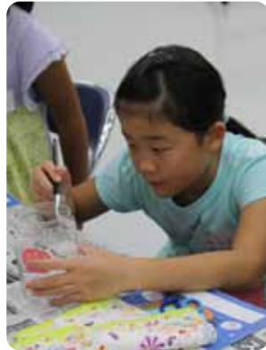
▲キレイに仕上げます