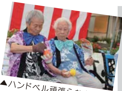
▲ハンドベル頑張らんな〜