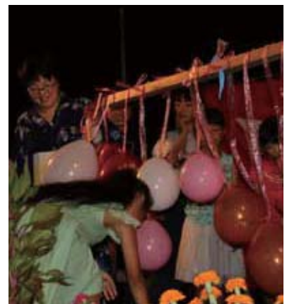
▲子どもたちによる風船割り抽選会