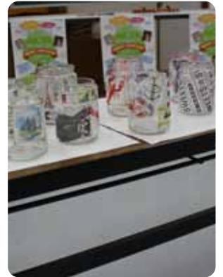
▲作成されたキャンドルカバー