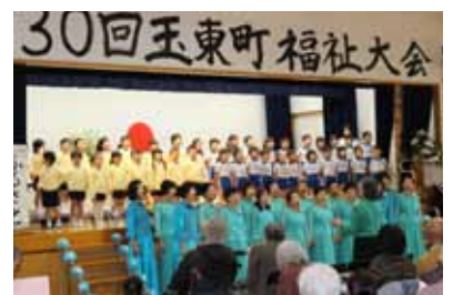
▲第30回福祉大会の様子