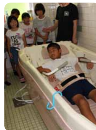
▲お風呂に入る機械を体験しました