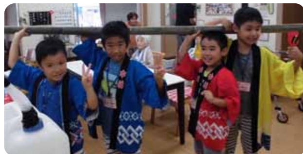
▲そうめん流しのお手伝い