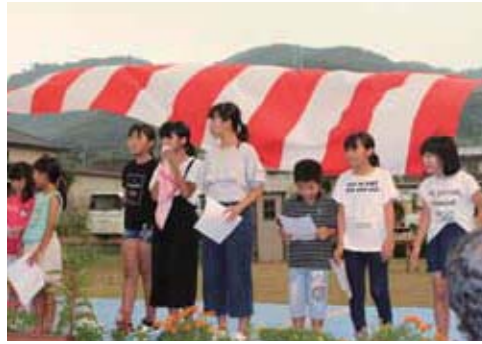
▲土生野子ども会による合唱