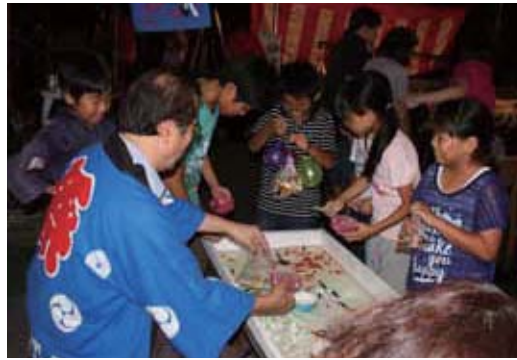
▲毎年大人気の金魚すくい