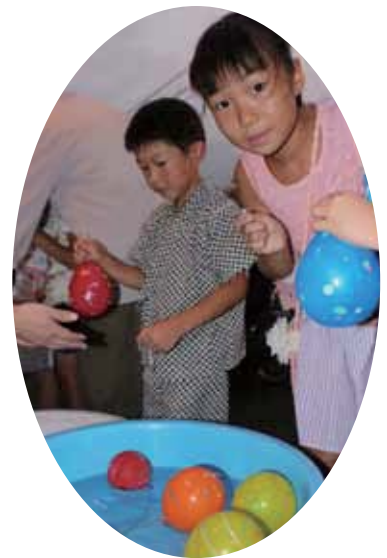
▲ヨーヨー釣りも大好評

7月21日に介護ホームはぶの夕涼み会が開催されました。今年も大勢の方々にお越しいただきました。ご利用者の皆様も楽しいひと時を過ごされていました。ご来場された皆様、ご協力いただいた皆様、本当にありがとうございました。