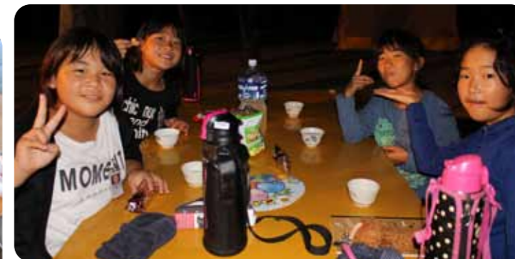
▲お友達もふえました!!