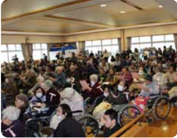
▲福祉サービスの利用者の方々もたくさん参加していただきました。