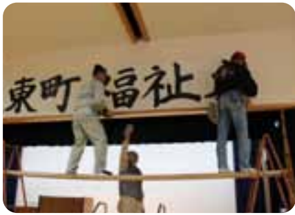
▲看板は建築組合の方々に設置していただきました。