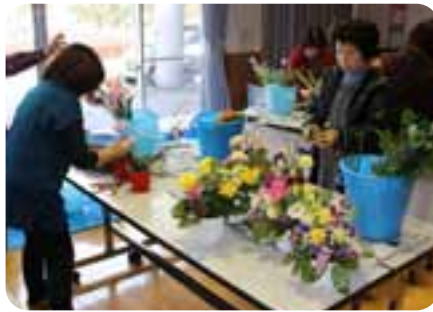
▲会場をキレイなお花で飾っていただいたフラワーアレンジメントの方々。