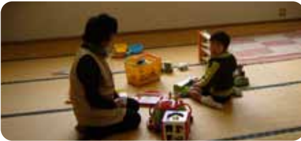
▲玉東子育て支援の会たんぽぽによる託児