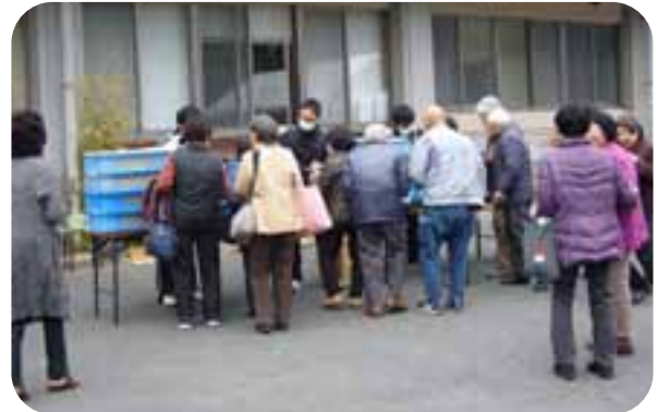
▲毎年のごとく大盛況!!!