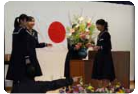
▲ステージ設営を中学生が手伝ってくれました。